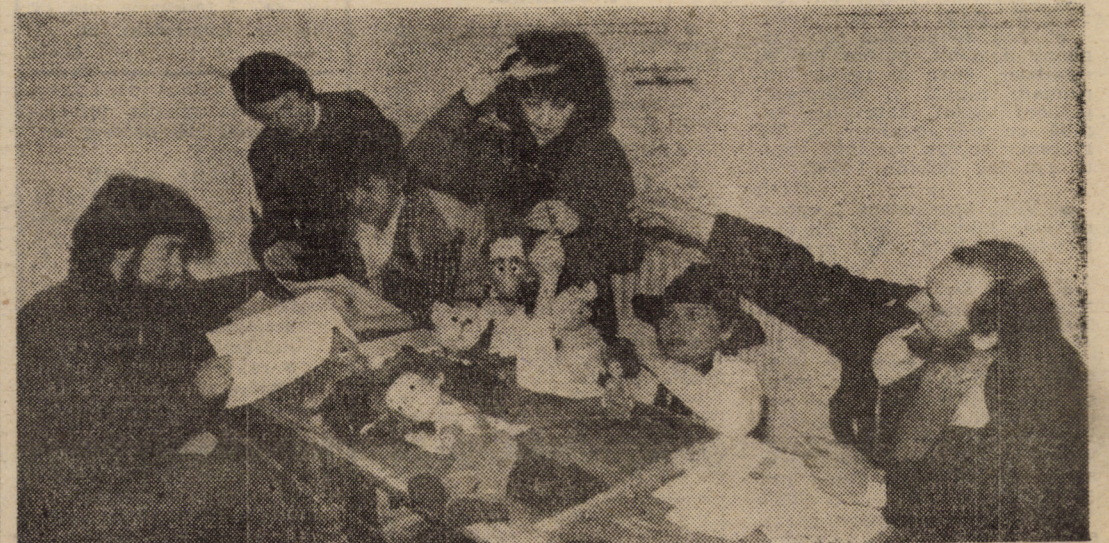
În lucru, la Teatrul de Păpuși din Sibiu, o viitoare premieră: „Un vis frumos, întors pe dos” de Dan Frățiciu, în regia și scenografia autorului

Important este ca viața economică să-și reintre în normal, ca oamenii, la locurile lor de muncă, să doveadă concret că altfel se muncește în condiții de democrație și libertate, conștienți fiind că aportul lor la reconstrucția României libere este determinant.