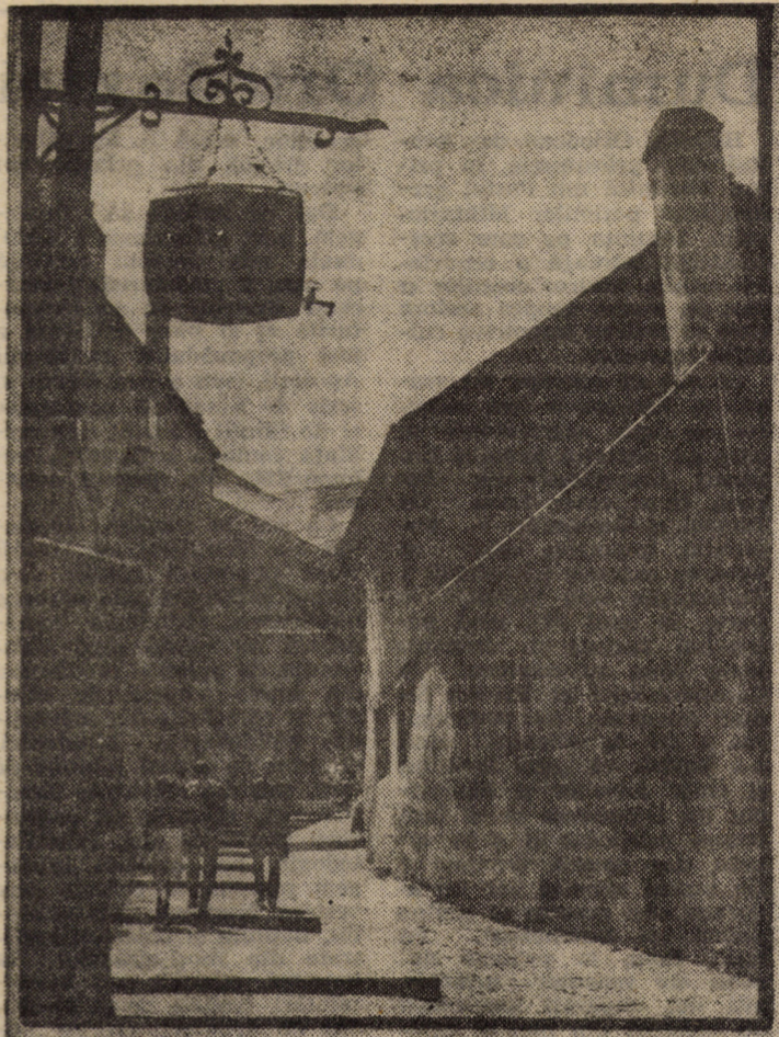
Sibiul de altă dată, Sibiul dintotdeauna — o imagine emblematică

Anul CVI, nr. 59 Duminică, 4 martie 1990 4 pagini, 50 bani