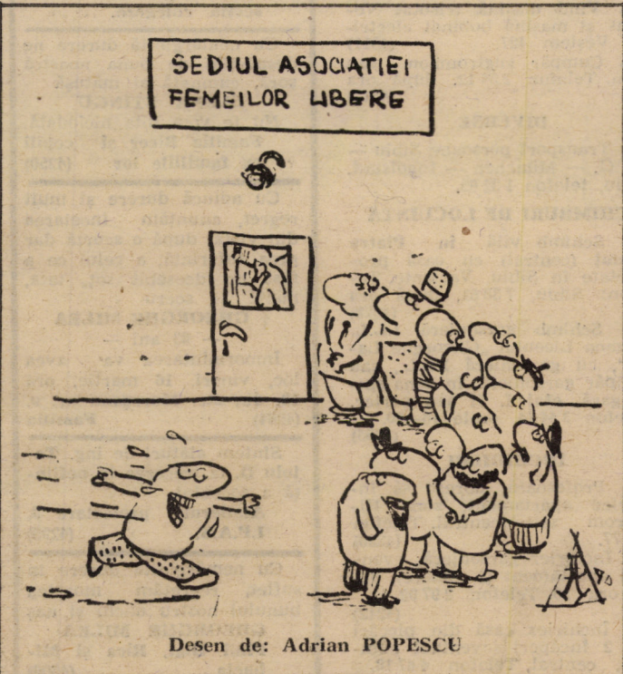
Desen de: Adrian POPESCU

Fondul de cîștiguri realizat din tradiționalul „Loz al mărtisorului”, în acest an, va fi vărsat în contul „Libertatea '89”, ne informează domnul Ioan Roman, directorul Sucursalei Sibiu a Administrației de stat „Loto-Pronosport”. Tot domnia sa ne-a informat că se pot cîștiga autoturisme „Dacia 1300”, televizoare color și cîștiguri în bani de la 15 lei la 50 000 lei. De subliniat că fondul de cîștiguri al participanților este suplimentat din fondul special al sistemului.