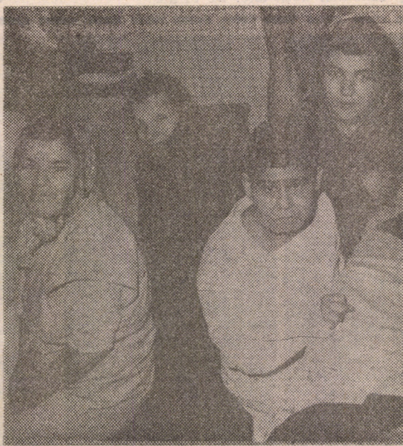
În fiecare privire se ascunde o lume de neînțeles, o tragedie personală terifiantă