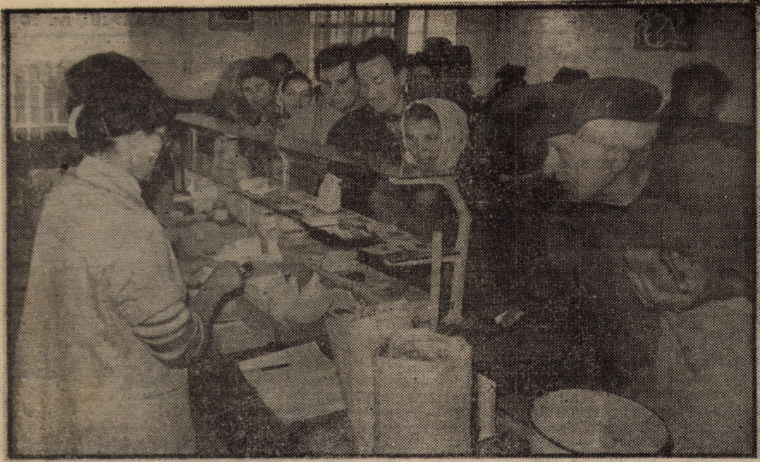
La magazinul specializat în desfacerea semințelor (str. Turnului) din Sibiu, aglomerație mare, în aceste zile de adevărată primăvară. Datorită interesului mare de care se bucură cultivarea legumelor se vind către populație cantități de semințe ce însumează 30—40 000 plicuri zilnic.