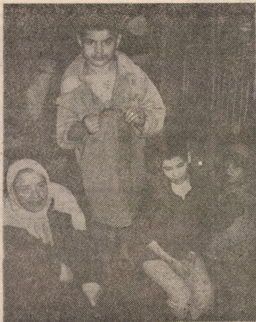
O tragedie multiplicată de „n“ ori: copiii