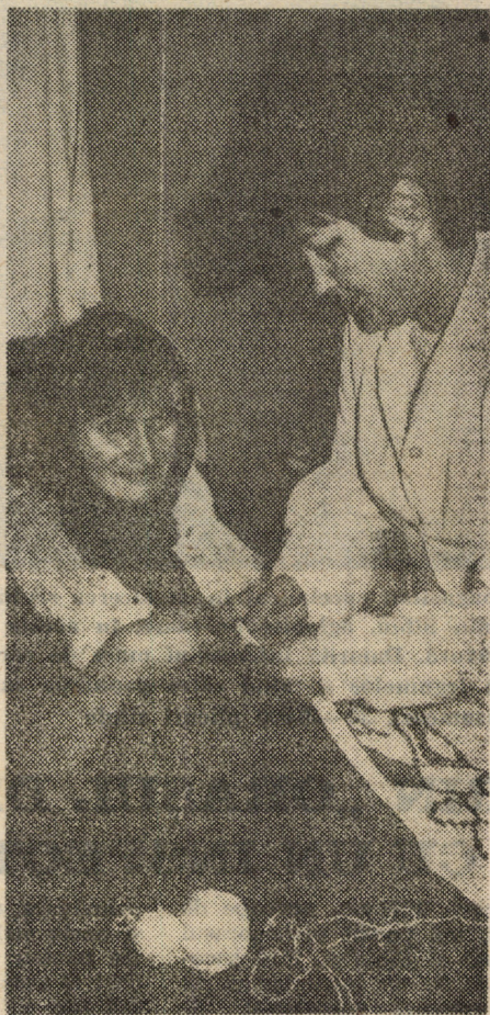
Sînt și excepții. Dar acestea nu pot decît să confirme regula...