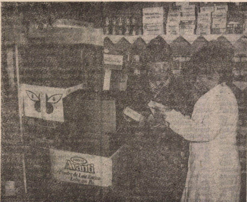
Am încheiat reportajul printr-o notă optimistă atît datorită afirmației interlocutorilor cît și abundenței din magazia de alimente, datorată în primul rînd ajutoarelor din străinătate. Acum, deci, este rîndul autorităților românești.