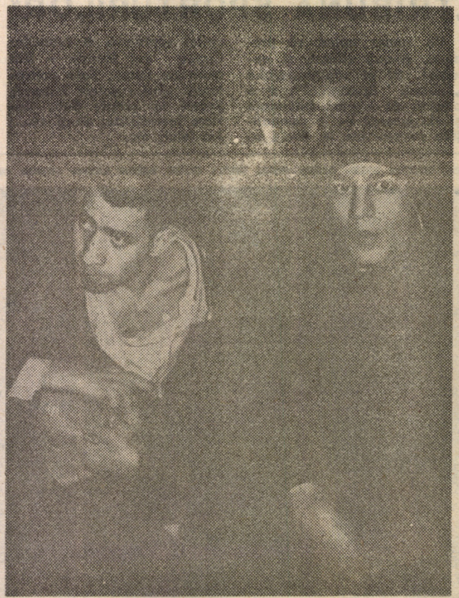
Orice asemănare cu o imagine dintr-o pușcărie nu este deloc întimplătoare!