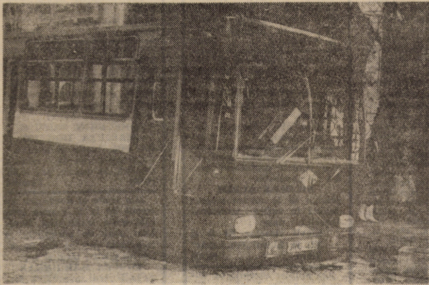
Vandalism? Poate chiar prea puțin spus...