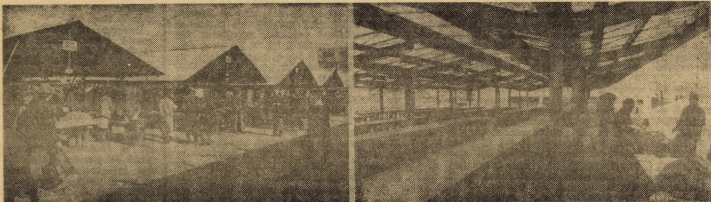
Contraste... contraste. Piața Cibin (stînga) — Piața Rahovei (dreapta)

Expoziția, reunind o mare varietate de lucrări, deosebit de accesibile marelui public, va fi deschisă zilnic între orele 8,00—18,00.