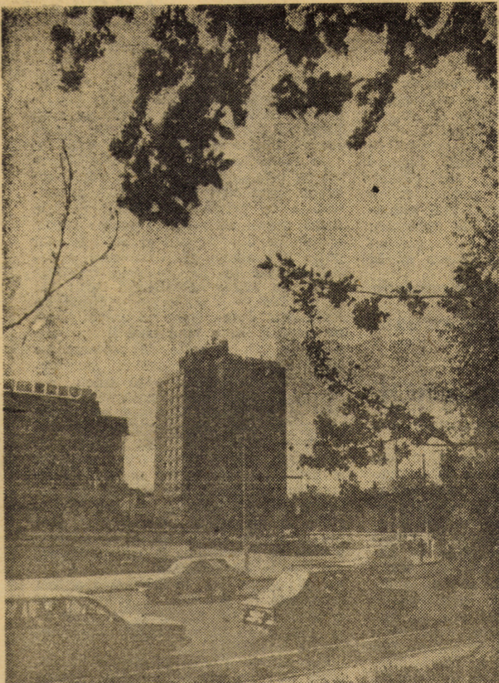
Insemne ale primăverii în Piața Unirii din Sibiu