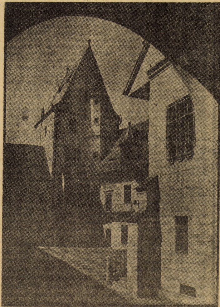
Monument de factură laică — primăria veche își caută o nouă dimensionare a conținutului pe măsura adevăratei istorii a sudului Transilvaniei