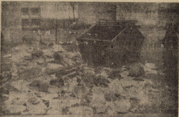
„Curățenia” orașului văzută în alb-negru. (In)salubritatea așteaptă sprijin de la ecologiști

Puțină pază în jurul acestor puncte de afișaj n-ar strica. Poliția nu are forțe. Atunci cine? (Ion S.).