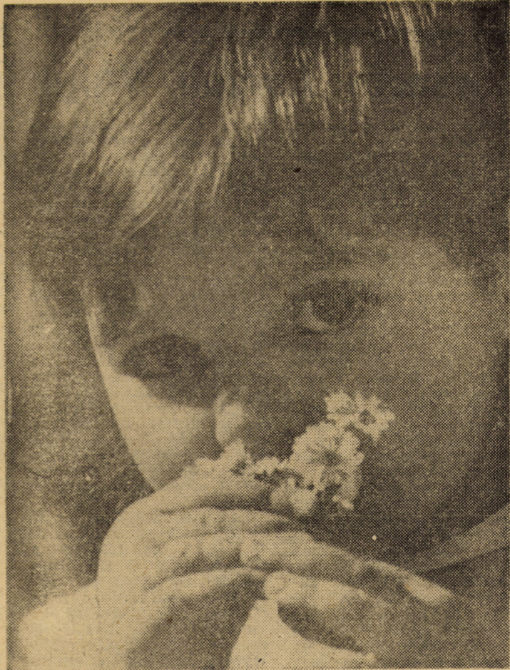
Unde ce miros au speranțele viitorului?