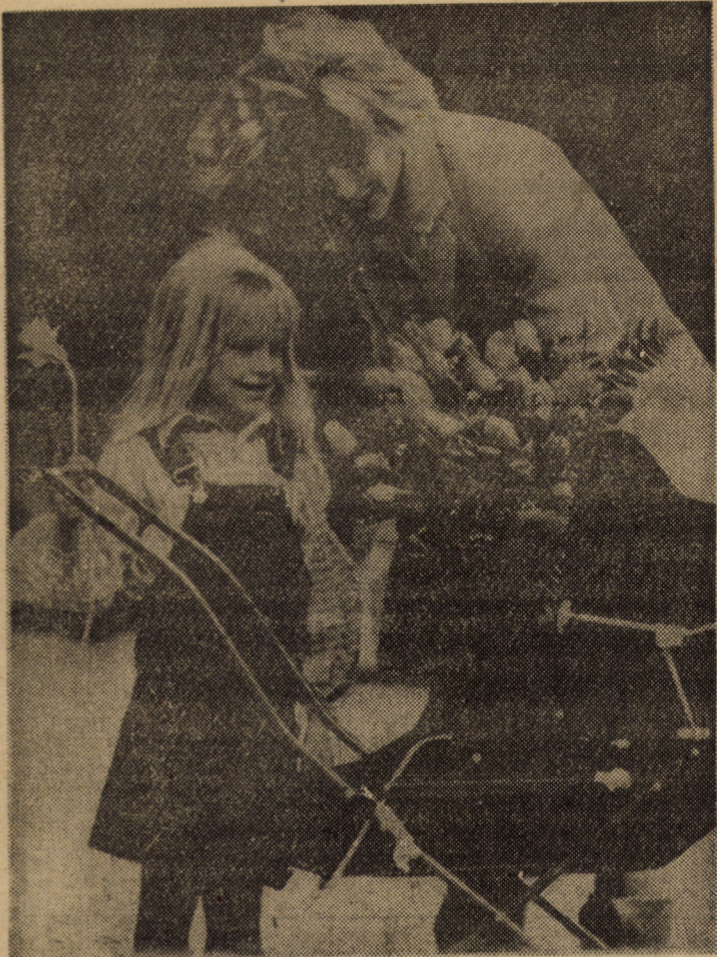
În fiecare zi — Ziua copilului...