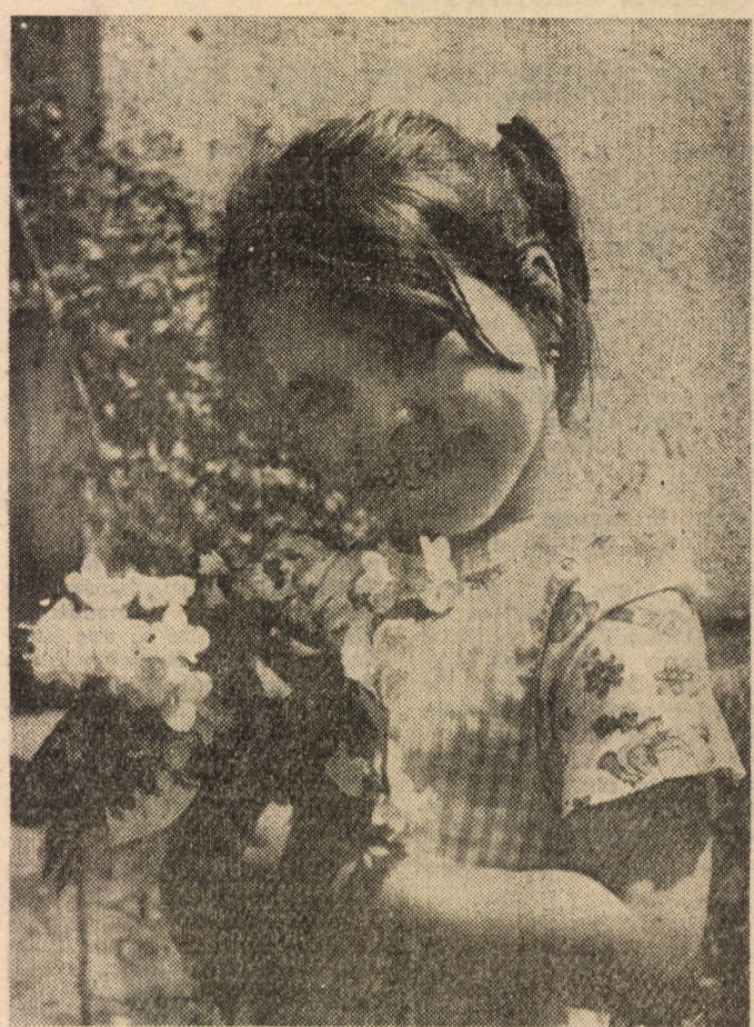
Încă nu sînt domnișoară, știu, în schimb, că sînt fetiță. Dar, de fapt, a cîta oară mi se spune... ștrengărită?