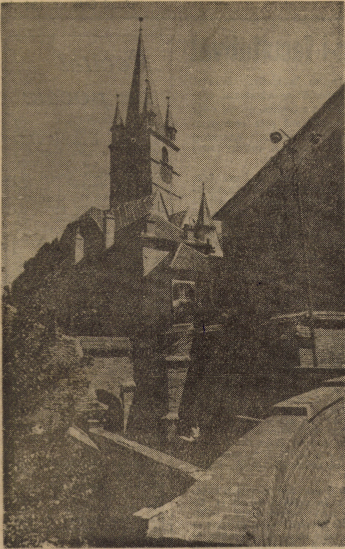
Sibiul vechi, cu magica sa „innodătură” de clădiri

Anul CVI. nr. 134—135 Simbătă — duminică, 9—10 iunie 1990 8 pagini 1 leu