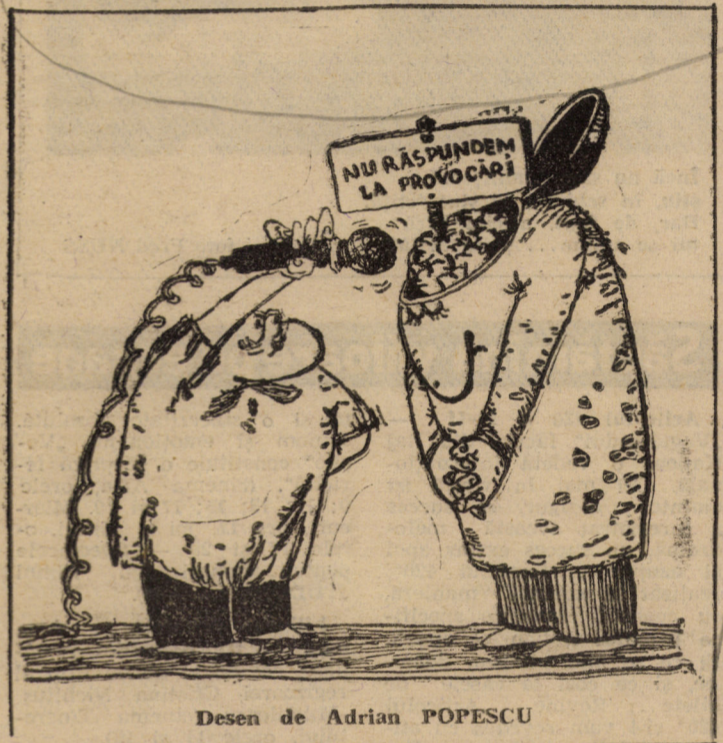
Desen de Adrian POPESCU

Miscarea ecologistă din România — Filiala Sibiu • Comisia pentru hidrologie și poluarea apelor.