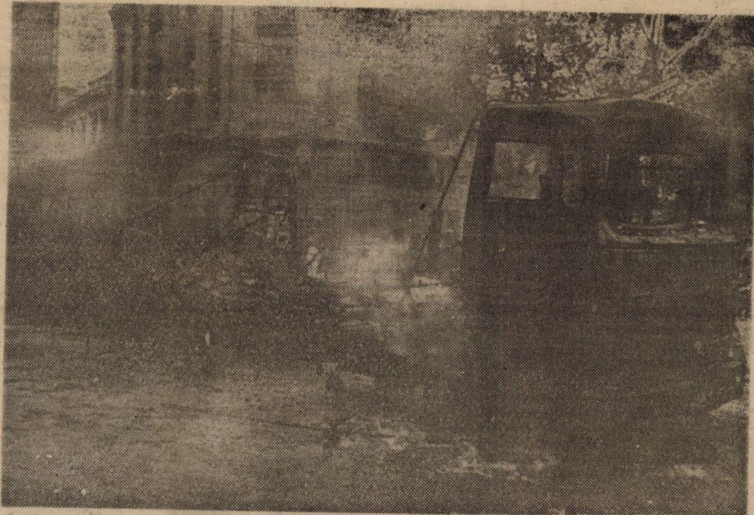
Miercuri: mașină calcinată la intersecția bd. Magheru cu str. A. Briand