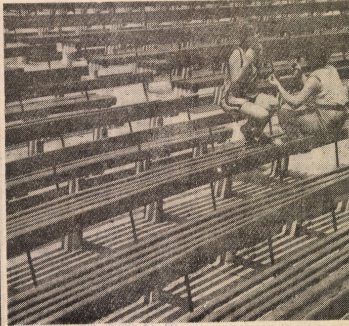
Precis a fost ofsaid!