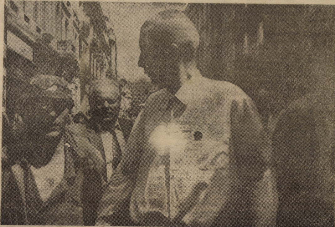
Un aruncător de sticle incendiară prins lângă Ministerul de Interne