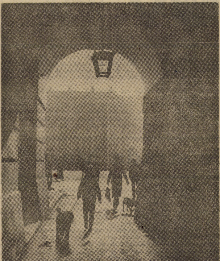
Sibiul istoric. Asemenea secvențe întilnești la tot pasul în bătrîna cetate a Sibiului. În imagine, una din piesele arhitectonice ale vechiului burg — tunelul Bisericii catolice