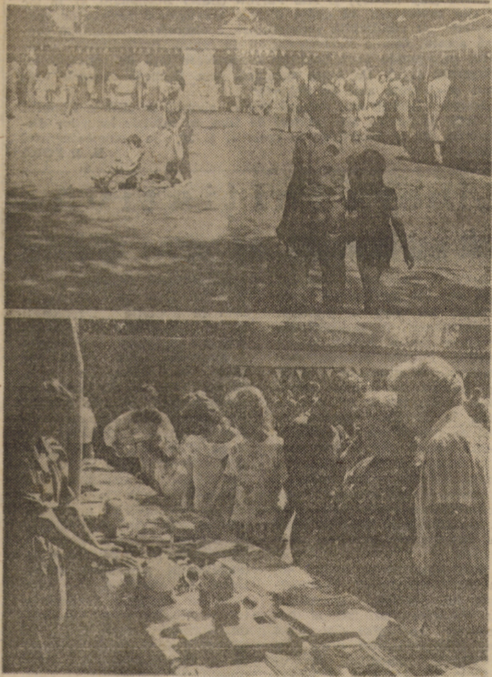
De cîteva zile, pe B-dul Victoriei 38 din Sibiu s-a deschis tradiționalul Tîrg al Cooperăției, de unde vă prezentăm cele două imagini. Vizitați-l!