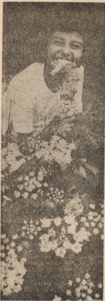
Vintu-i leagănă pe frunte Flori de cimp și flori de munte, Cerbi cu tîmplele-n scinteii