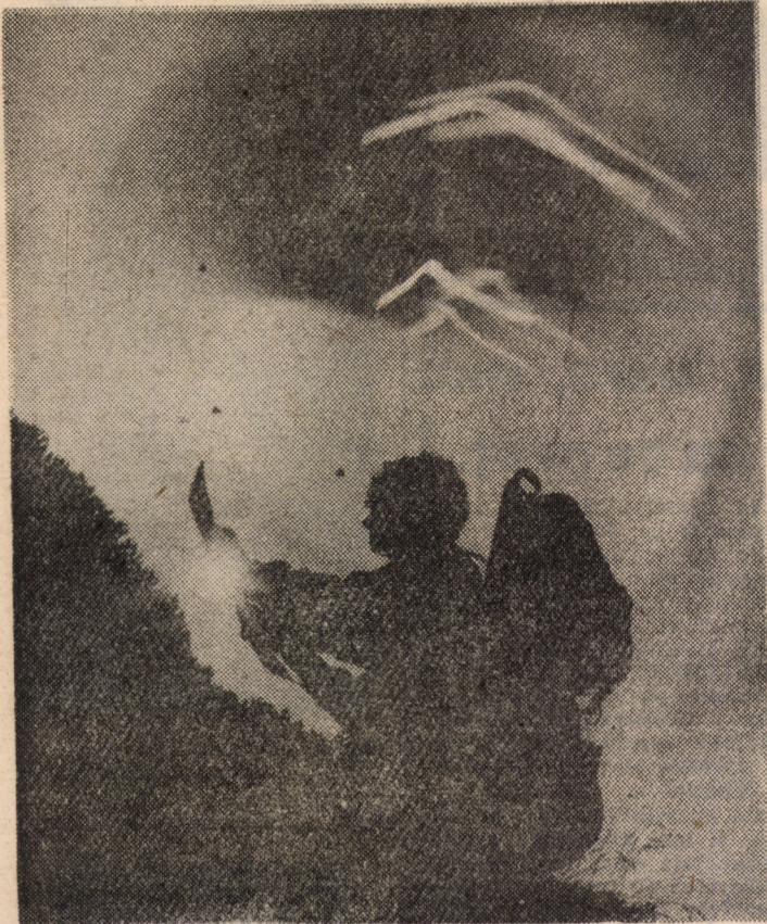
In genunchi în căutarea luminii. Merită!