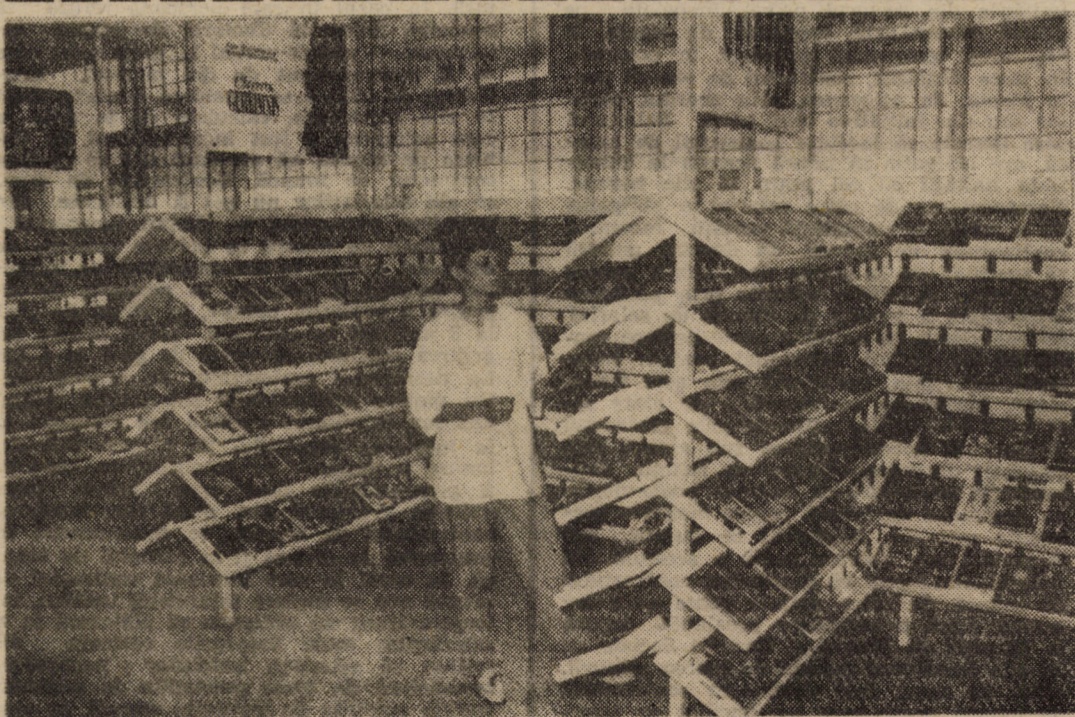
Biblioteca de videofilme „Proten” din Sibiu, este tot mai prosperă. Succes în continuare în beneficiul cetățenilor!