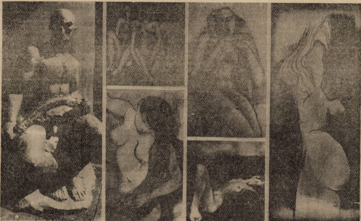
În organizarea U.A.P., filiala Sibiu, marți, 7 august a.c. a avut loc vernisajul unei expoziții de pictură, grafică și sculptură, cu tema „NUDUL”. Cele 30 de exponate pot fi admirate la Galeriele de Artă „Sirius” din localitate.