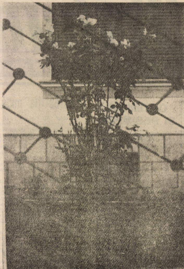
Tristețea florilor captive...

„Am stat de vorbă cu d-l Ion Iliescu aproape două ore. A fost abordată o gamă largă de probleme privind prezentul și mai ales viitorul minorității germane din România. S-au discutat și alte aspecte colaterale, să le zicem, cum ar fi, de pildă, încercarea d-lui Iliescu de a afla — nu printr-o întrebare directă, desigur, ci mai mult sugerată — dacă în spatele declarației forumului nostru vizavi de problematica germanilor din România nu au stat alte motive, ca de pildă