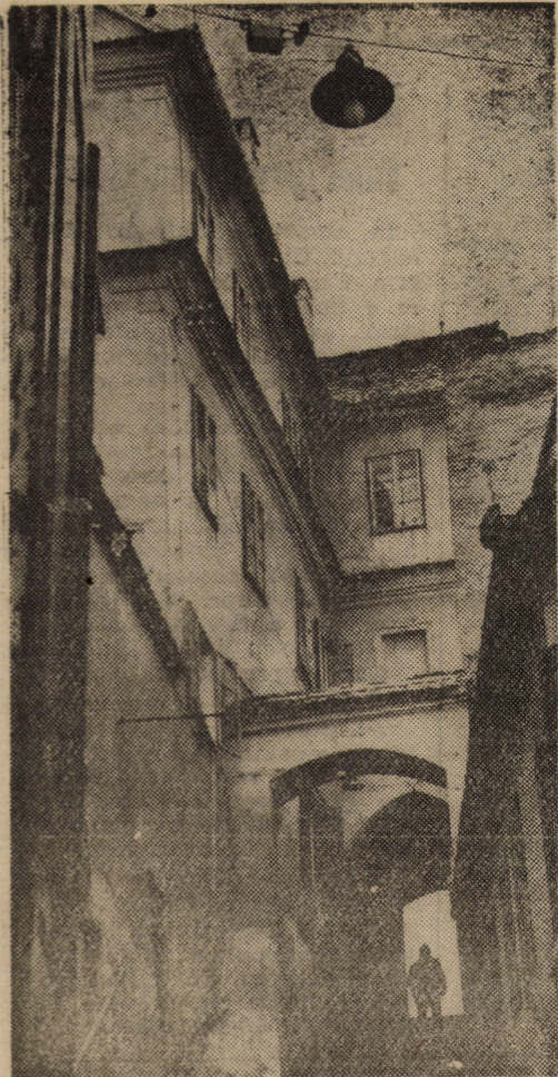
Una din căile de acces spre „orașul de sus” ale Sibiului vechi: Scările Aurarilor