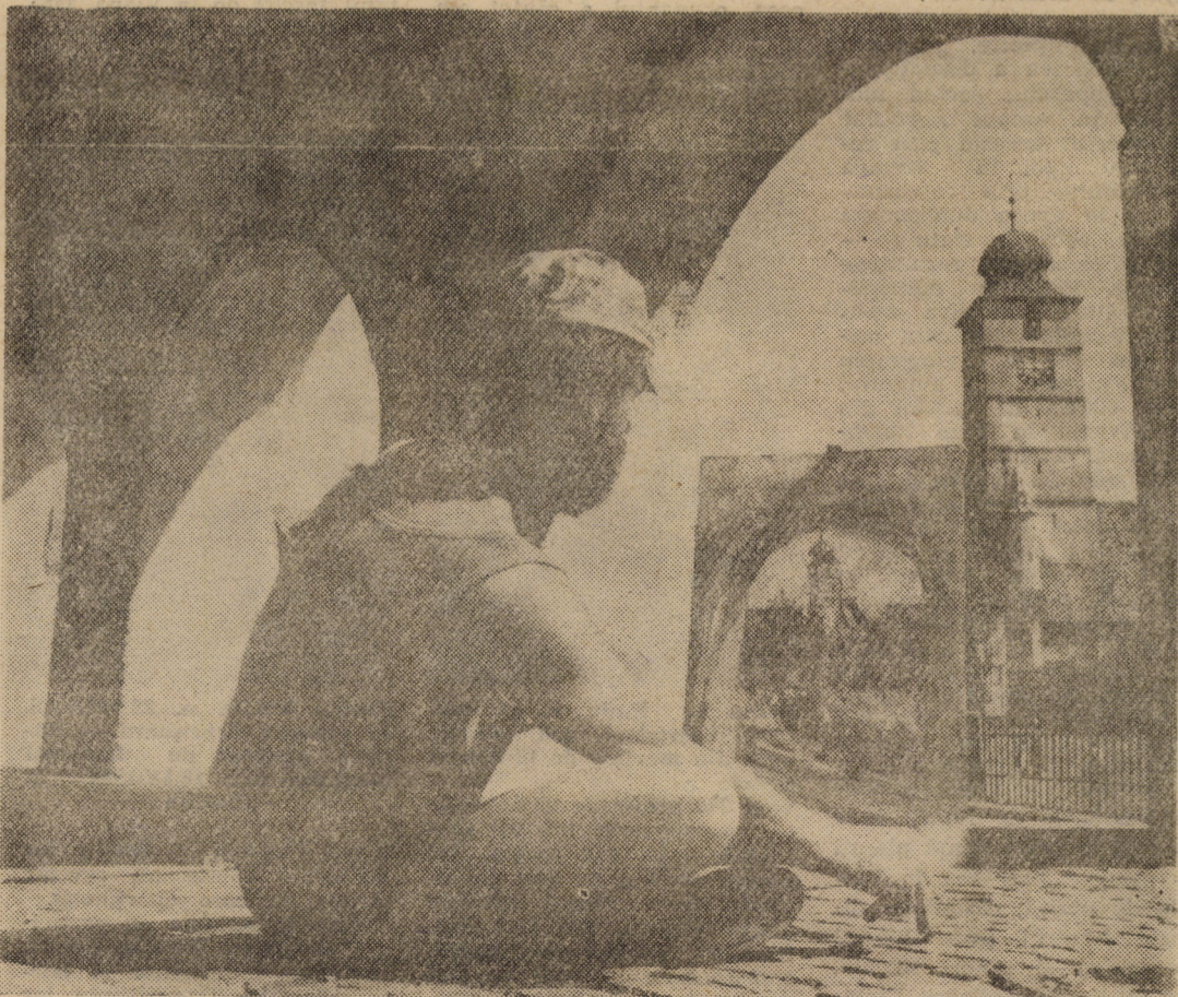
După cum era de așteptat, unul dintre artiștii plastici, participanți la Tabăra de creație, de la Avrig, și-au ales ca motive arhitectura Sibiului vechi. Lucrările realizate în timpul șederii în tabără au fost prezentate în cadrul unei expoziții, găzduită de Liceul „Gh. Lazăr” din Avrig.