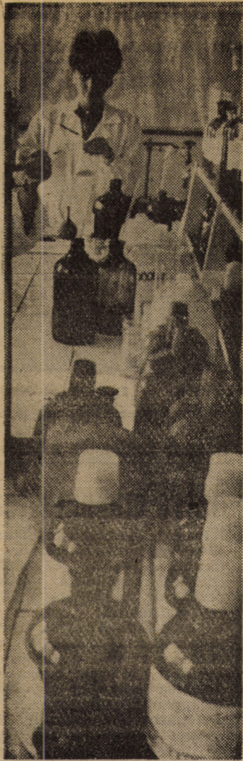
Laboratorul de analize al Oficiului de gospodărire a apelor Sibiu — unul din punctele cheie ale acestui element vital