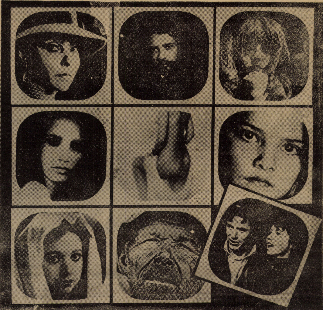
Ne reînnoim, cu plăcere, invitația de a vizita cea de a doua expoziție a Salonului Internațional de Artă Fotografică Sibiu '90

Cine și de ce are interes ca România să devină o uriașă casă de nebuni? Cine și de ce are interes să nu se lu-