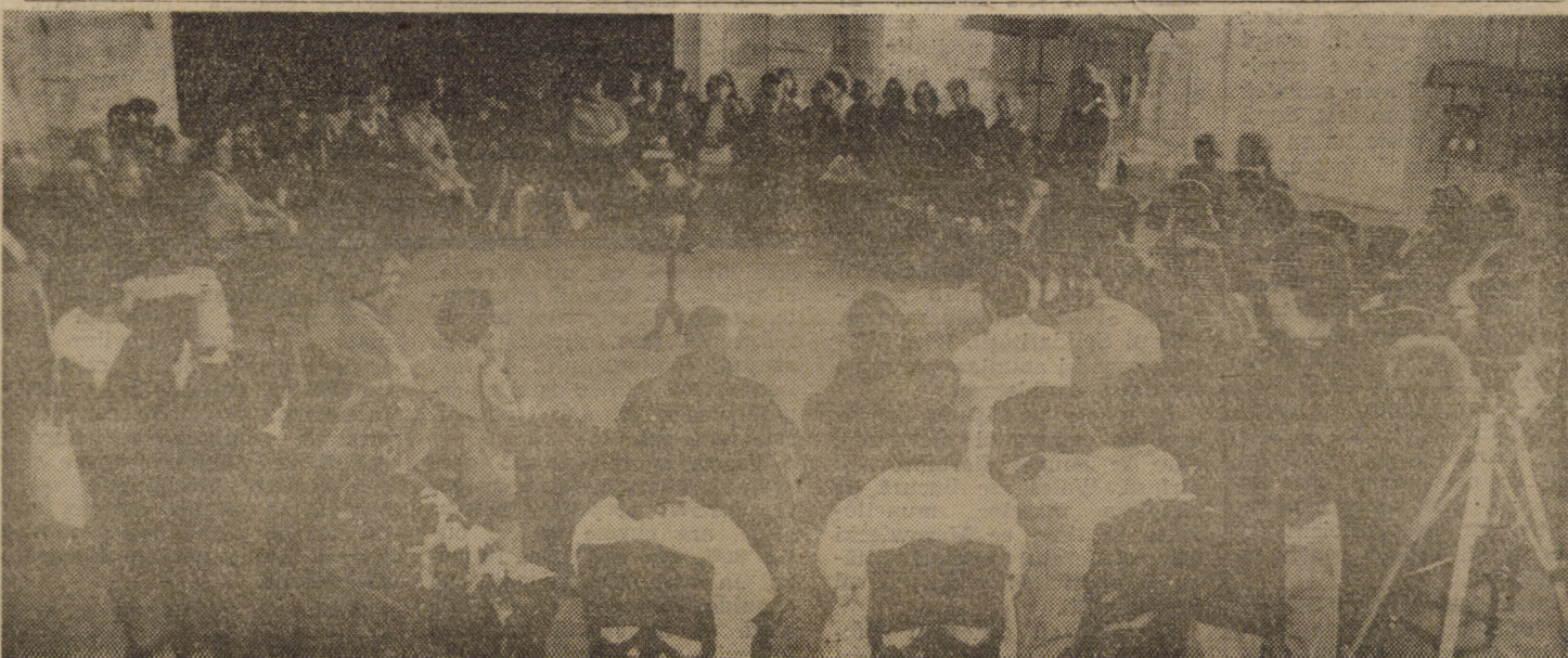
Aniversarea Cercului literar de la Sibiu, în sala cea mai luminoasă a Bibliotecii ASTRA — una din emoționantele manifestări ale Festivalului de Artă desfășurat între 8—14 octombrie în orașul nostru

(continuare în pag. a III-a) Ion SORESCU