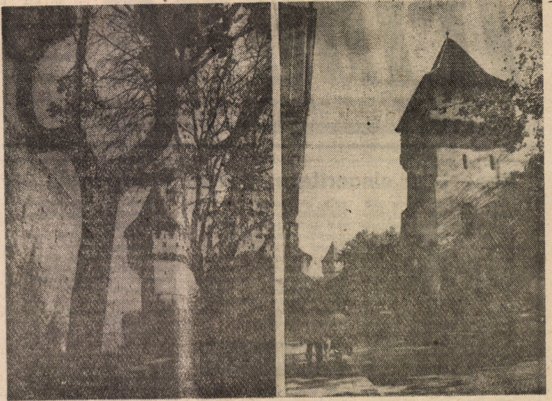
Toamna '90 ne răsfăță cu paleta-i coloristică, scaldînd într-o lumină caldă și blîndă, metereze încărcate de istorie și legendă ale burgului sibiuan