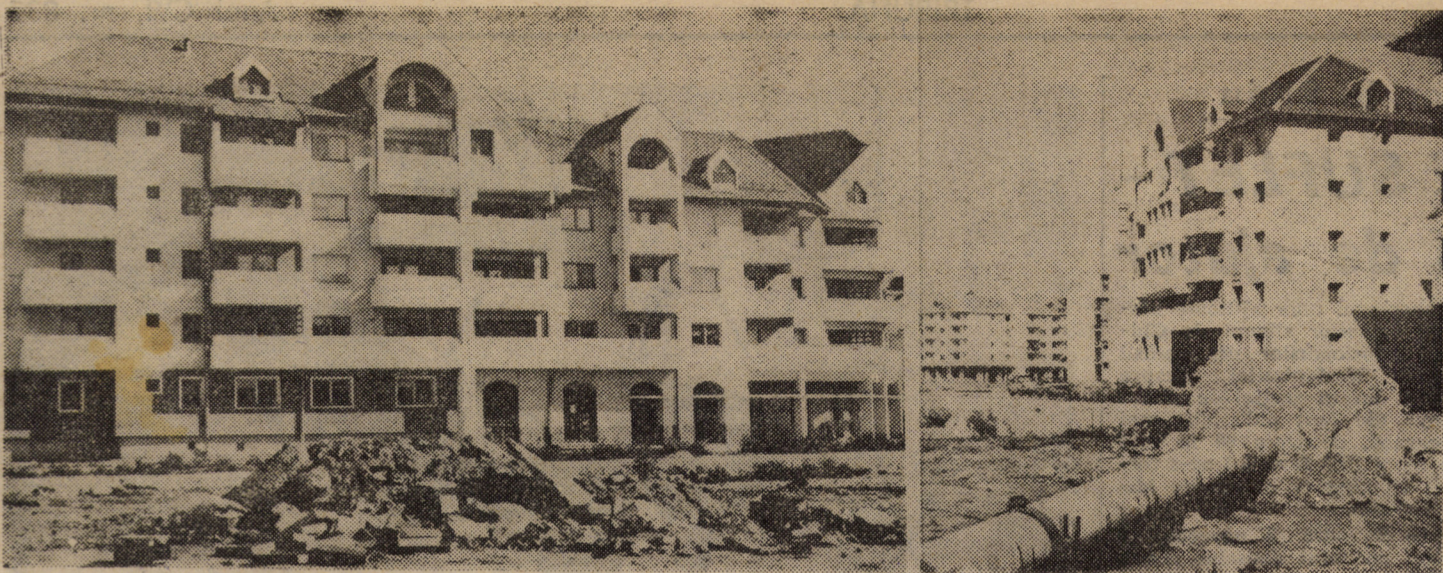
În zona sistematizată dintre str. N. Teclu și 9 Mai din Sibiu, unde s-au ridicat noile blocuri (parțial redată în imaginile alăturate), și unde lucrările edilitare au demarat, drumurile de acces sînt încă departe de-a fi terminate. Mormanele de moloz, stîlpîi din beton dislocați etc., care mai sălășluiesc în acest perimetru, odată acoperite de zăpadă, vor îngreuna și mai mult finalizarea drumurilor de acces. Deci, atenție, iarna bate la ușă!