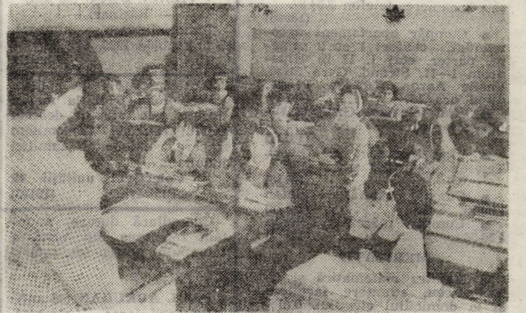
De unde or fi știînd cei din clasa I să răspundă la atîtea întrebări?