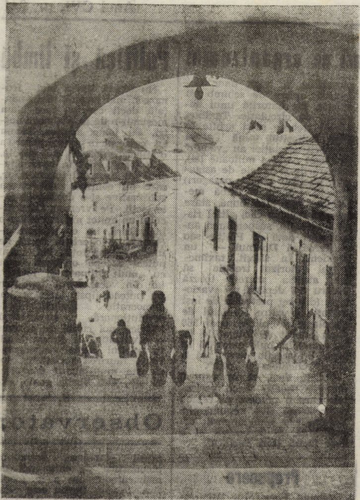
Scările ce duc spre str. Turnului — unul din drumurile de acces spre „Orașul de Jos” al Sibiului

Anul CVL nr. 241 Vineri, 2 noiembrie 1990 4 pagini 1 leu