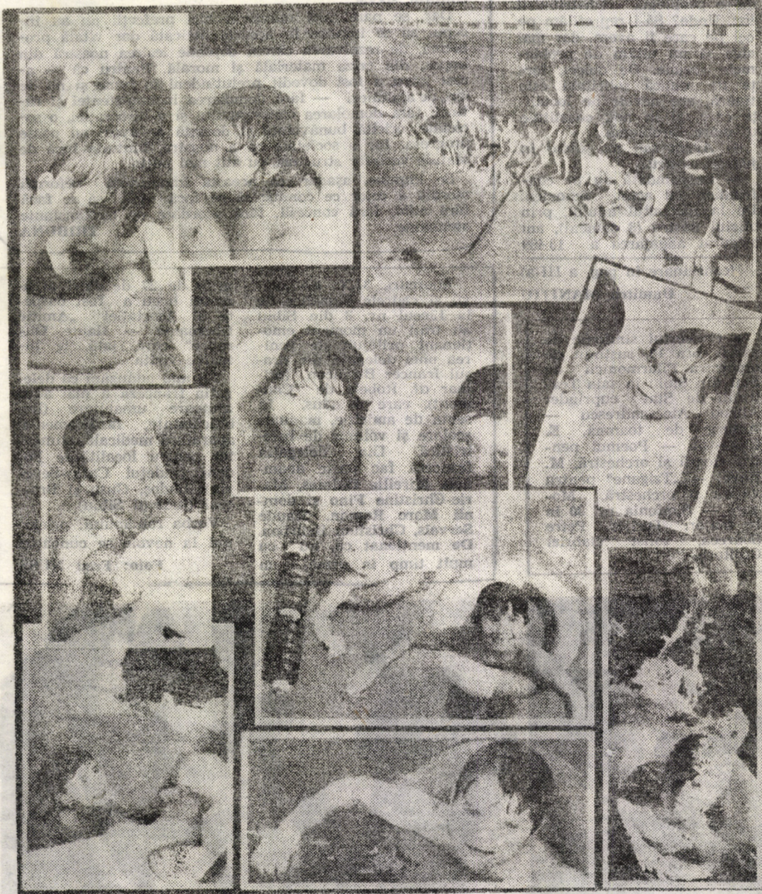
Activitatea bazinului Olimpia continuă tradiția în munca de performanță a sportivilor înotători sibieni, care au făcut și fac cinste natației românești. Totodată, și-a mărit evantaiul activităților desfășurate aici: însușirea tainelor înotului de către copii, recuperarea medicală a copiilor cu deficiențe somatice, ca și gimnastică medicală și de întreținere pentru femei. Toate aceste activități se desfășoară sub îndrumarea unui grup de profesori competenți. În fotomontaj, imagini surprinse cu cei mai mici învățăceși într-ale înotului