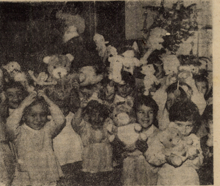
(Sălaj), Căminului-spital pentru copii din Răcari (Dimbovița), Casei de copii din Victoria (Brașov) și altor orfelinate și case de copii din România. Pentru acest gest emoționant și curat un răspuns unanim și din inimă adresat copiilor din Anglia: Thank you!