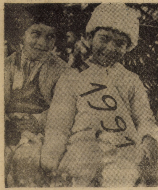
Binecuvîntăm venitul Anului Nou, un an al gîndului bun, al muncii și al prosperității!

Și îmi dau seama că nu ar trebui să povestesc ce am văzut pentru că, iată, a început să îmi crească în suflet dorul zăpezilor dintr-un sat de măr, unde fetele se dau în leagăn de diamante. L. BREZAE