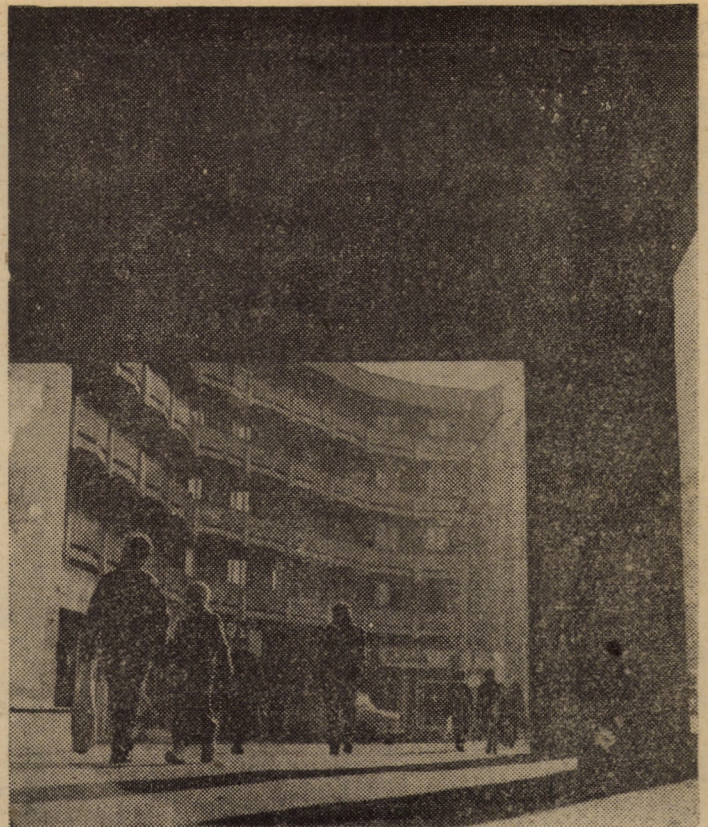
Orașul cade-n ceața iernii — fără zăpadă, fără vlagă. Vacanța a trecut fără bucuria copiilor.