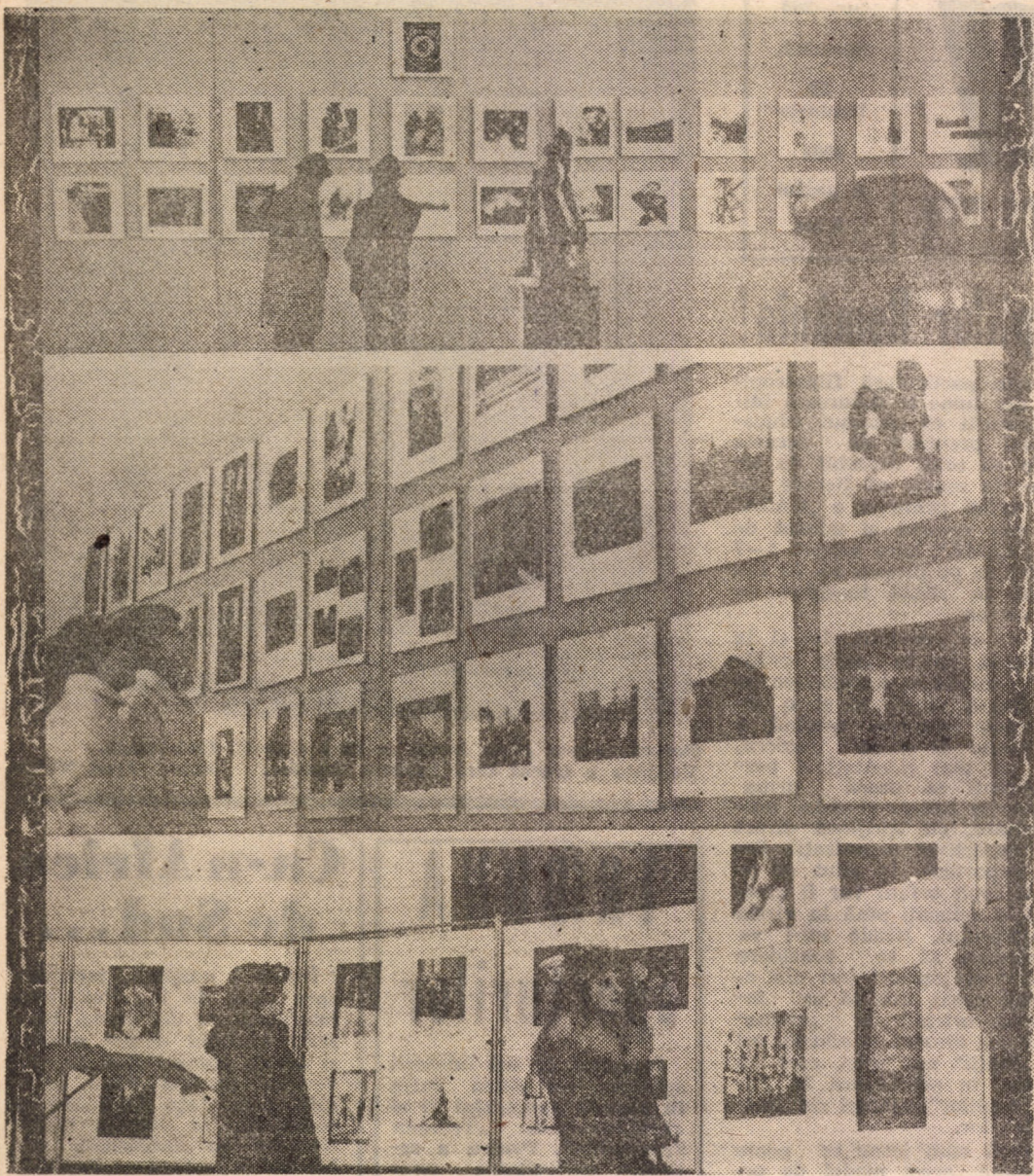
Aspect de la Salonul fotografic „FOTOARM” deschis și în aceste zile la Casa Armatei