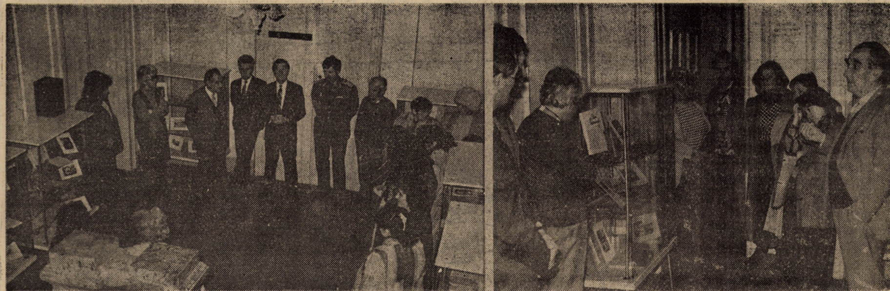
Sub genericul „Lăcașuri ale literaturii române“, la biblioteca ASTRA din Sibiu a avut loc vernisajul unei expoziții documentare de bibliofilie și cartofilie cuprînzînd ediții princeps, manuscrise, cărți poștale ilustrate cu imaginile caselor (astăzi, memoriale) în care s-au născut și au creat clasicii literaturii române.

Manifestarea va avea loc vineri, 16.01.1991, ora 11, în aula „Avram Iancu“ a Universității.