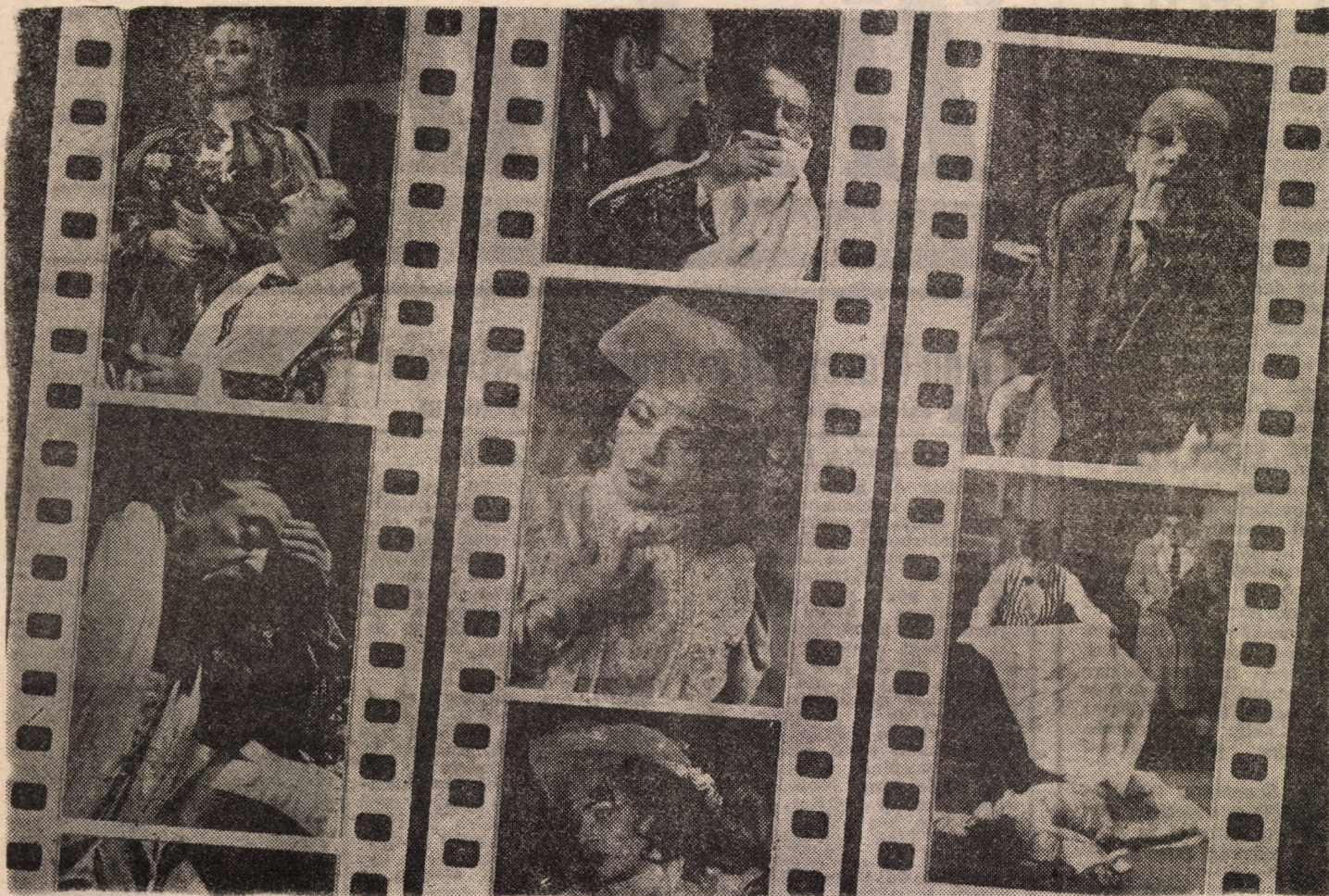
Imaginile de față au fost surprinse de fotoreporterul nostru Fred Nuss în timpul spectacolului cu premiera în limba germană „Der Kammersänger” de Frank Wedekind, în regia și scenografia lui Horațiu Mihai, spectacol ce a avut loc ieri seară pe scena Teatrului de Stat din Sibiu