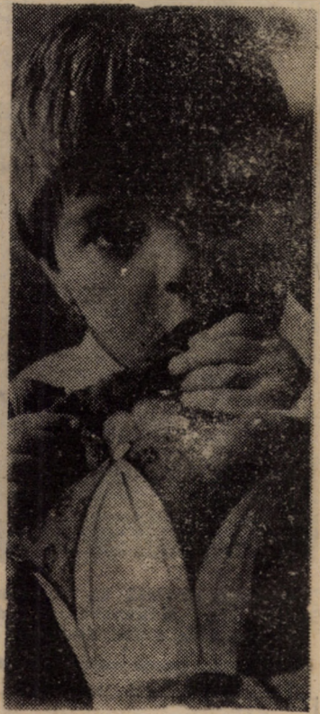
Ce lume ne pregătiți?