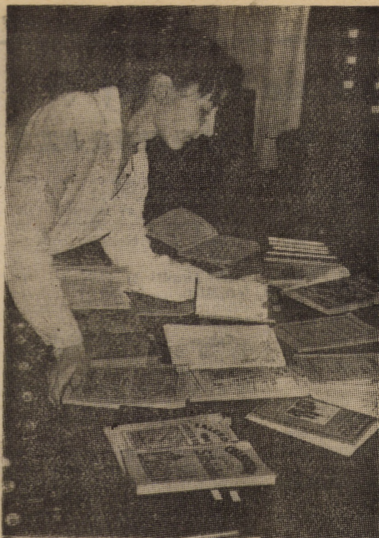
Răsfoind colecția de calendare vechi ale Bibliotecii „Astra” din Sibiu