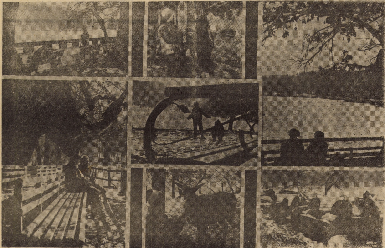
Dumbrava Sibiu — o sursă de nesfîrșite frumuseți, nu numai pentru fotoreporter

Stațiunea Păltiniș găzduiește în perioada 30.I.—3.II. a.c., concursul republican de schi alpin (slalom uriaș și special) rezervat copiilor din unitățile școlare ale județelor alpine ale țării. Concursul va fi dotat cu „Cupa Băișoara”.