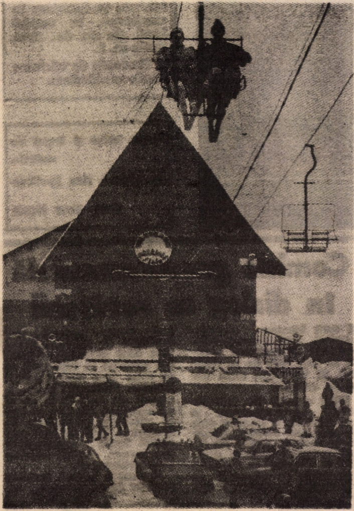
Simbătă, 2. II. 1991 și duminică 3. II. 1991 „perla“ montană a județului nostru, stațiunea Păltiniș, va fi din nou gazdă bună pentru cei mai tineri schiori alpini ai țării. Aici, timp de două zile se va desfășura concursul republican — dotat cu „Cupa Șoimii Sibiu“ — etapa a IV-a. În imaginea surprinsă: unul dintre punctele... fierbinți ale stațiunii — telecaneul.

și tot Arhipelagul capătă haina galbenă caracteristică pădurilor noastre de foioase. E o comprimare fantastică, cu un efect deosebit asupra psihicului omului. Acest lucru este posibil datorită faptului că avînd în permanență soarele deasupra capului, fotosinteza este permanentă. Să nu vă imaginați că vegetația e înaltă. Planta cea mai înaltă pe care am găsit-o nu știu dacă avea 12-13 cm. Sigur că dominanții, sînt lichenii, în general, dar există și o floră caracteristică care nu diferă eu mult ca aspect de flora noastră alpină, dar speciile sînt altele. O floră foarte viu colorată. Aici florile nu sînt izolate, răsfirate, ci sînt sumate în nuclee, în covoare întregi, ceea ce reprezintă o altă modalitate de acomodare la regimul de viață arctică. A consemnat L. O. NEMES