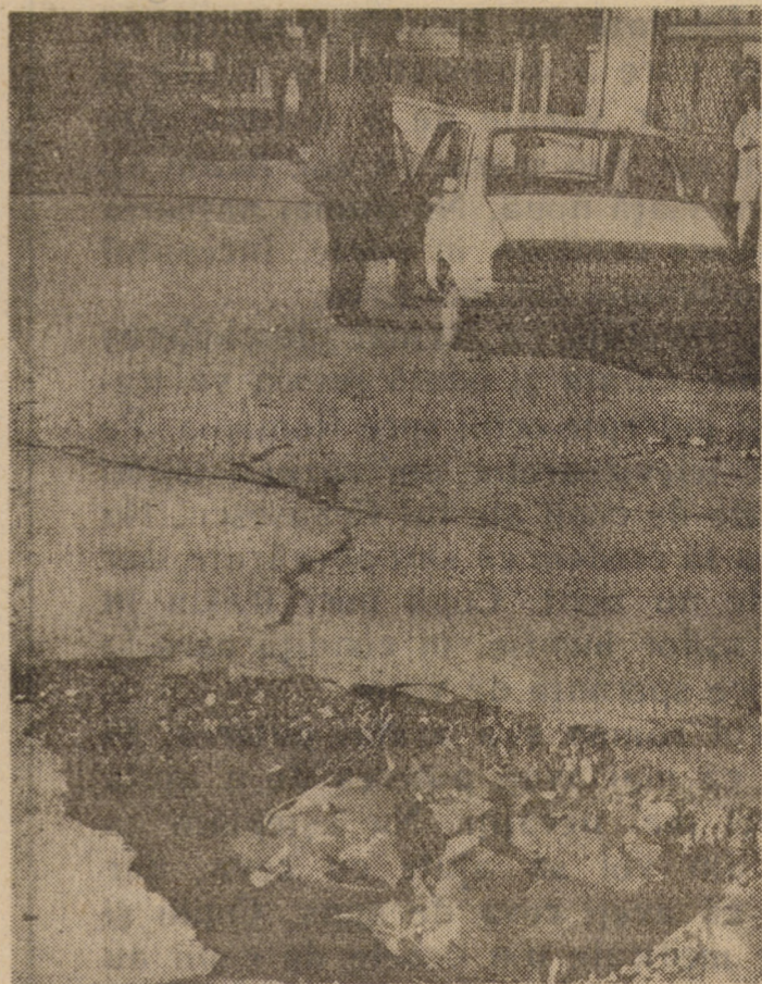
Sîntem încredințați că municipalitatea Sibiului caută soluții pentru buna gospodărire a orașului dar, mărturisim, nu credem c-o face „forind” asfalturile întru „deliciul” automobilistilor. Adresa: intersecția străzilor Oituz și Mărăști...

● În legătură cu problema apei din zona Copșa Mică — Acumularea de la Zetea este terminată; constructorul este dispus să execute și conducta de aducțiune. Primul ministru și-a însușit propunerile Prefecturii, urmînd ca Ministerul de Finanțe, împreună cu Prefectura județului Sibiu și cele ale altor două județe, să asigure finanțarea lucrării, estimată la circa 1 miliard de lei. Se precizează că, atît Mediașul, cît și Copșa Mică, nu au în regim pluvial normal, probleme de ordin cantitativ al apei, ci calitativ. În zonă au fost efectuate două lucrări: una de suplimentare a debitului cu 100 l/sec. și una de îmbunătățire a calității apei, aceasta nefînd, însă, rezultatele scontate, avîndu-se în vedere gradul foarte mare de poluare a râului Tîrnava și imposibilitatea asigurării tehnologiei optime de filtrare a apei în stația de tratare. În varianta „Zetea”, problema este rezolvabilă în circa 2 ani, dacă lucrările de aducțiune încep în această perioadă. Se speră în asigurarea, de către Guvern, a tehnologiei de filtrare și tratare a apei, în condițiile executării, de Prefectură, a celorlalte lucrări de canalizare și gospodărie comunală a orașului Copșa Mică.