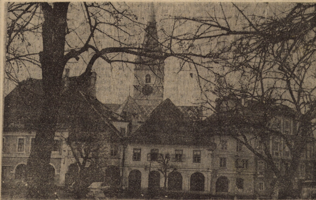
Sibiul rămîne pentru noi orașul în care trăim și în care trebuie să ne creștem și educăm copiii. Să îl prețuim — E AL NOSTRU!

Anul CVII, nr. 304 Marți, 5 februarie 1991 4 pagini 2 lei