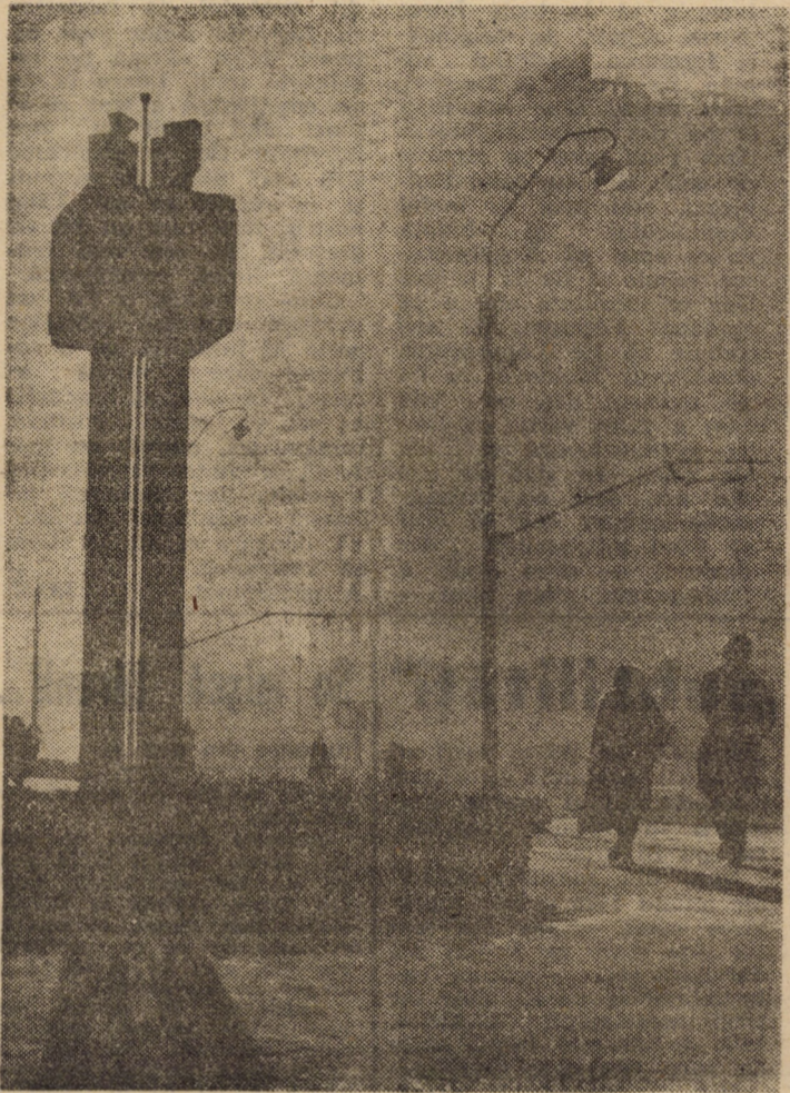
Contralumină de ianuarie