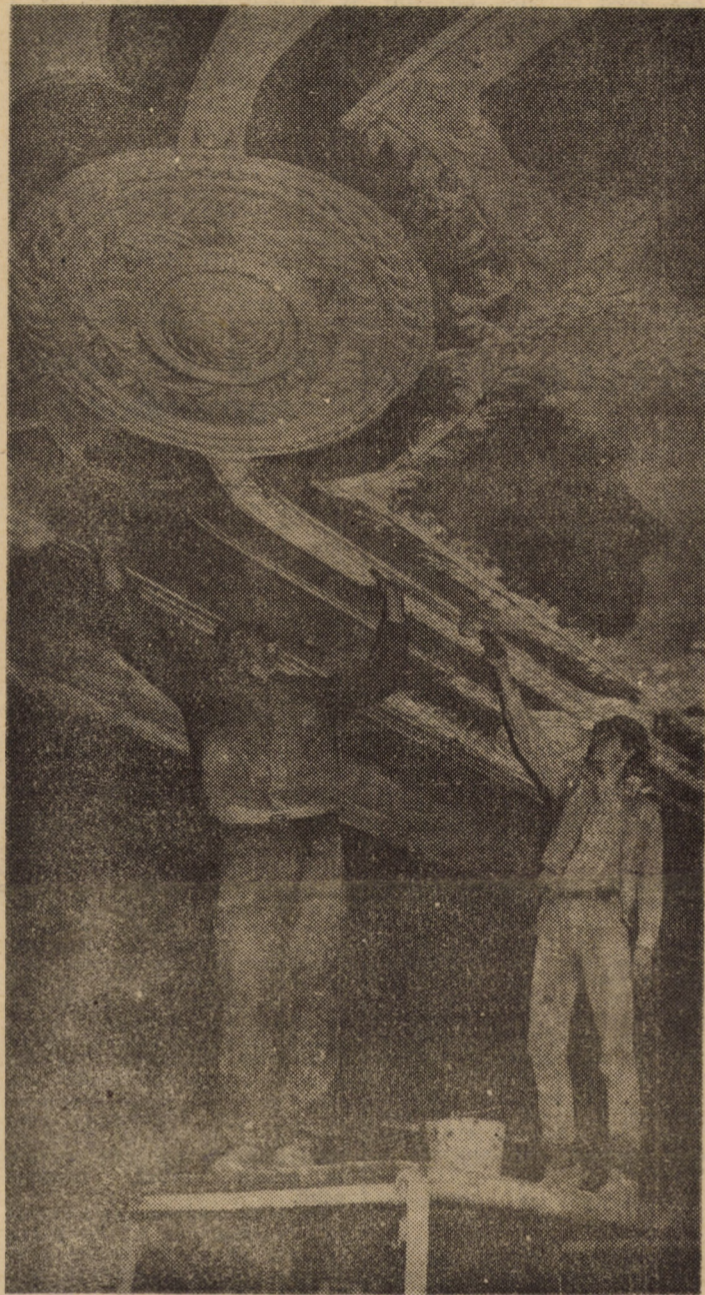
După cum am mai anunțat, Muzeul Brukenthal din Sibiu este închis temporar în vederea executării unor ample lucrări de renovare pe cele două nivele ale pinacotecii. În prezent se lucrează intens la restaurarea tavanului din cunoscuta sală Baroc

Hotărîrea 1228/1991 stabilește doar cadrul general, atît în domeniul comerțului și turismului, cît și în celelalte ramuri economice. Dar, cel puțin în turism, repre-