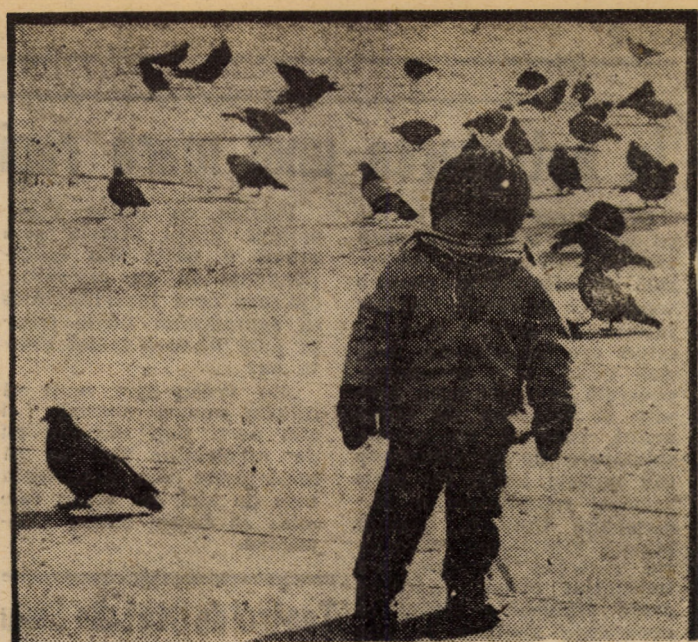
Dup-atita frig și ceață... copil și porumbei (Fr. NUSS)