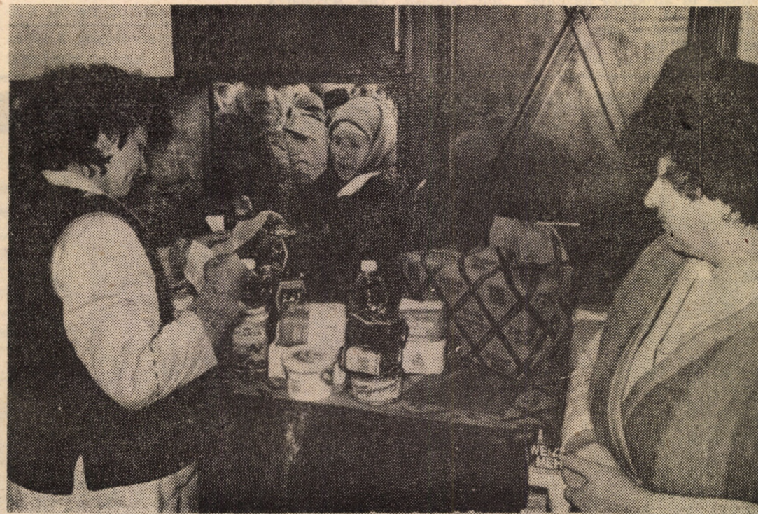
Magazinul nr. 62 din cartierul Vasile Aaron — desfacerea alimentelor gratuite primite în cadrul acțiunii de ajutorare organizată de Guvernul German se face în mod ordonat, cu operativitate