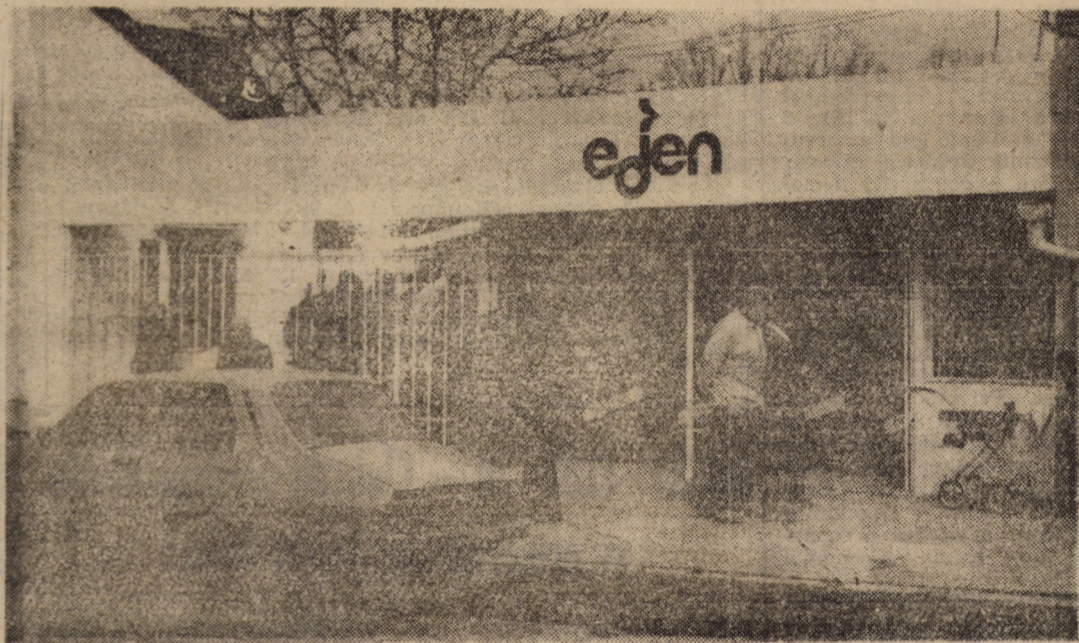
Chiar și în zilele de duminică spațiile puse la dispoziția vinzătorilor și cumpărătorilor sibieni de către firma „Eden” se dovedesc neîncăpătoare