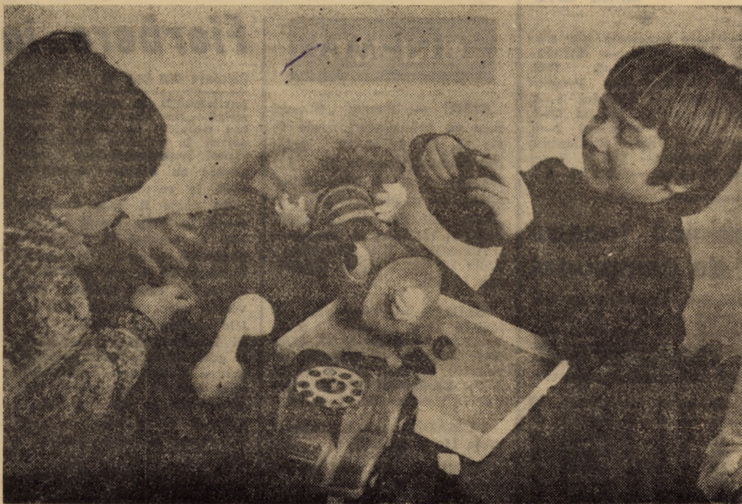
Privatizare... în miniatură!