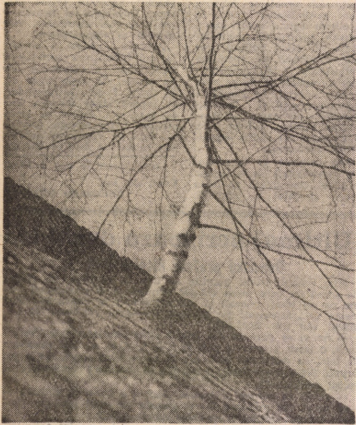
Când natura înfruntă cetatea

La Brăila a avut loc prima etapă a Campionatului național de dirt-track, individual seniori, la care au luat parte 12 sportivi care și-au trecut testele de admitere. Iată cum arată clasamentul: 1. Marius Șoaită (I.P.A. Sibiu) — 10 puncte; 2. Gheorghe Marian (Metalul) — 10 p.; 3. Sorin Ghibu (I.P.A. Sibiu) — 7 p.; 4. Mircea Agrișan (Metalul) — 6 p.; 5. Aurelian Oaneș (I.P.A. Sibiu) — 4 p.; 6. Dan Bogdan (I.P.A. Sibiu) — 4 p. (I. ILIE)