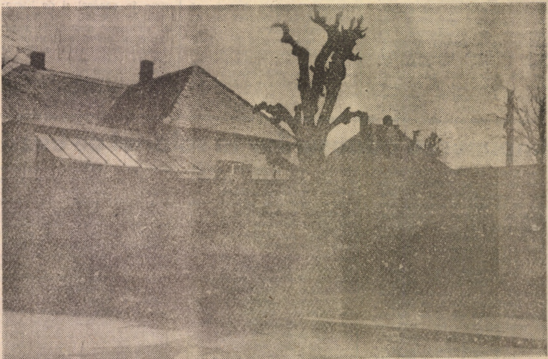
Oameni buni, ferii-vă copacii! Vin cei de la „înfrumusețarea” orașului și lasă în urmă doar araci pe post de pomi! Dacă ar fi la fel de harnici și încercinați și cînd e vorba de curățenia Sibiului, aproape că i-am putea ierta pentru aceste delictive ecologice.

temat tren blindat”, orele 10; 15; 17 și 19, iar de la ora 10 „Broșuța fermecată”. MEDIAȘ — Progresul: „Nu vreau porno”, orele 9; 11; 13; 15; 17 și 19. Interzis sub 16 ani. Central: „Cabaret”, orele 9; 11; 13; 15; 17 și 19. LL. Caragiale: „Pentru cîtiva dolari în plus”, orele 10; 15; 17 și 19.