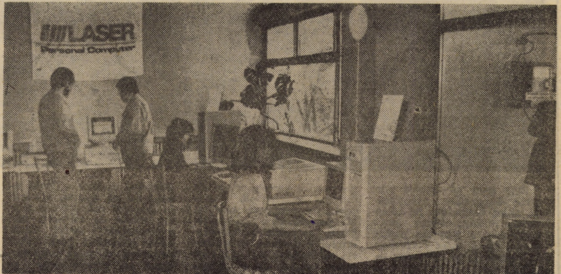
Zilele trecute, la sediul SSAS-S.A. (fost CENTRUL TERITORIAL DE CALCUL ELECTRONIC din SIBIU) a fost prezentată o interesantă expoziție de calculatoare (compatibile IBM-PC) și echipamente periferice, organizată de firma LASER-COMPUTER ROMANIA și SOCIETATEA DE SOFT APLICATIV și SERVICII S.A. SIBIU. Amănunte în unul din numerele viitoare.