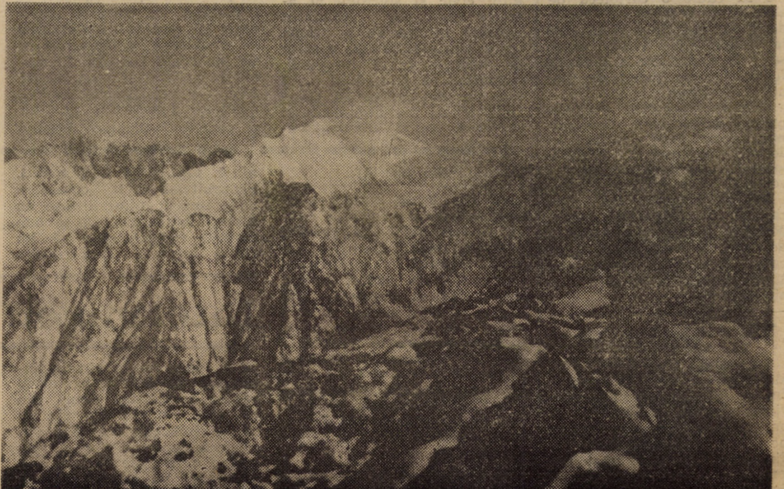
„Făgărașul se pregătește să întâmpine primăvara”...