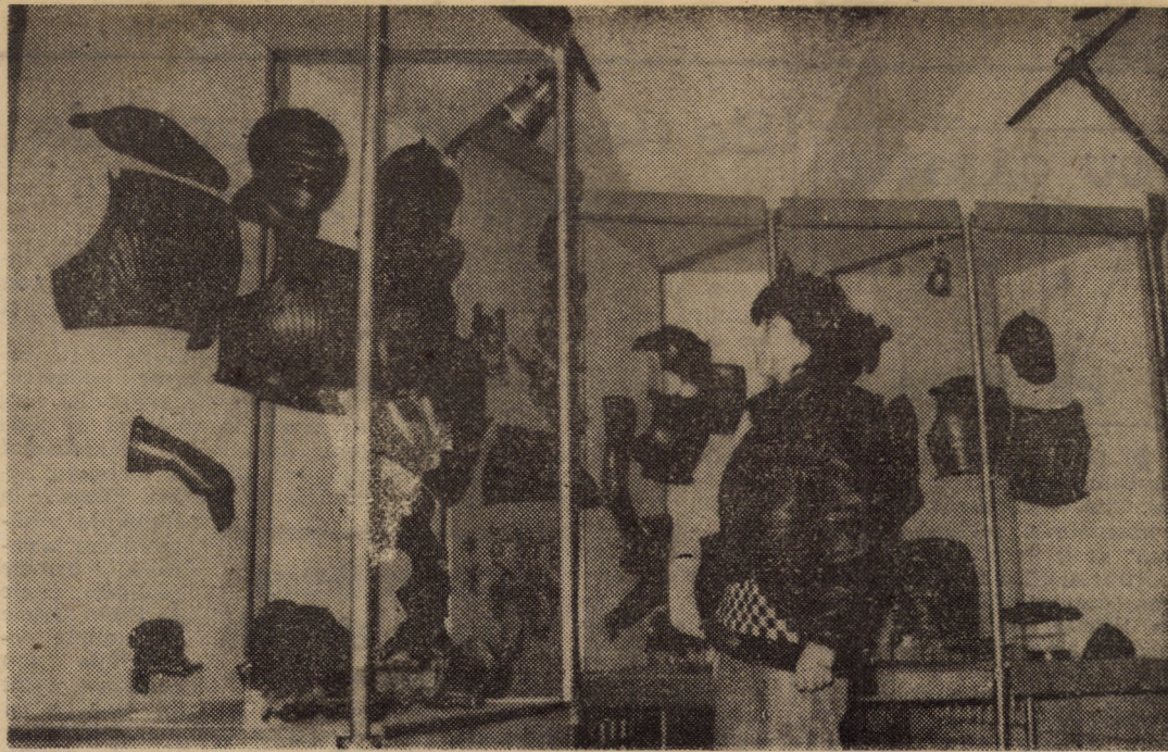
În pagina a II-a amănunte privind vernisajul expoziției „Arme și armuri”