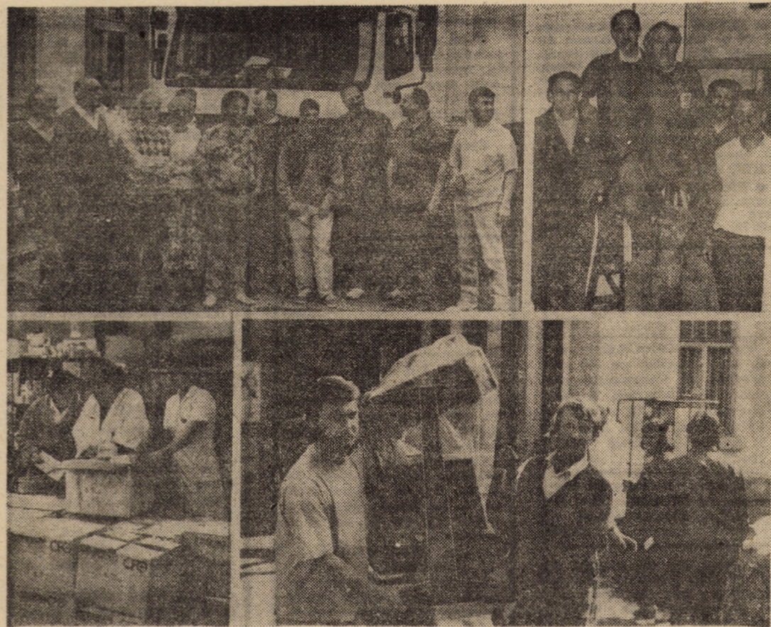
O TRAINICĂ ȘI GENEROASĂ PUNTE DE PRIETENIE ROMÂNNO-OLANDEZĂ