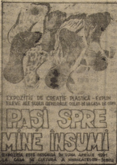
EXPOZIȚIE DE CREATIE PLASTICĂ — EXPLIN TELEVIZIE ALĂ ȘCOLII GENERALE ORLAT-DE LA CASA DE COPII

Vă asigurăm, stimați cititori, că răspunzînd interesului pe care presupunem că îl veți arăta acestor documente, vom realiza, în 24 aprilie, un tiraj suplimentar ce se va difuza prin rețeaua de chioșcuri din municipiul Sibiu.