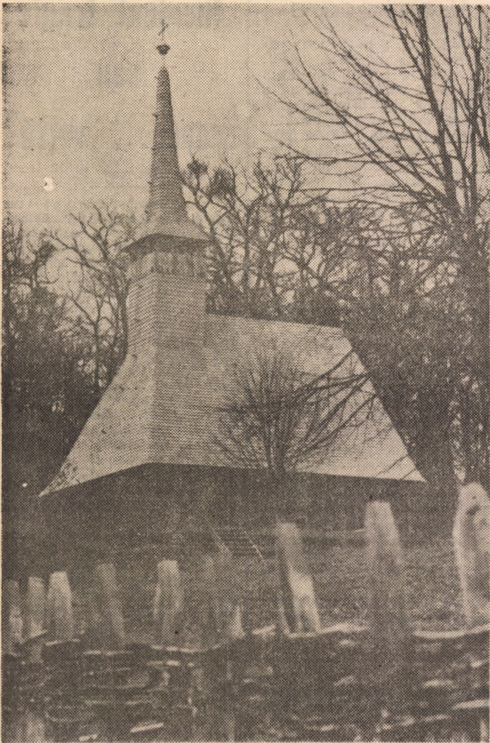
Un nou obiectiv la Muzeul Civilizației Populare din Sibiu: Biserica din Bezded, județul Sălaj