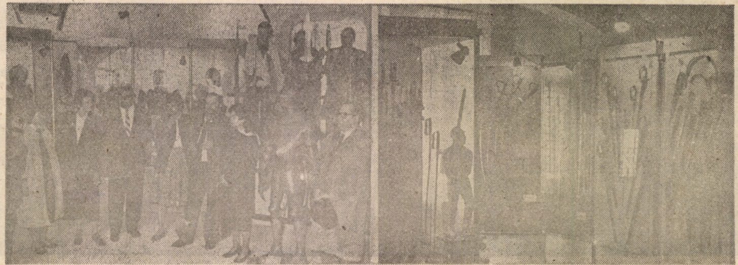
Clasicism-romantism, iz medieval, tipuri ideale inexistente practic în stare genuină, reperabile numai la o analiză în retrospectivă, iată posibilități oferite de „Expoziția de arme și armuri”, organizată de Muzeul de istorie. Exponatele pot fi vizionate zilnic orele 9—17 cu excepția zilei de luni