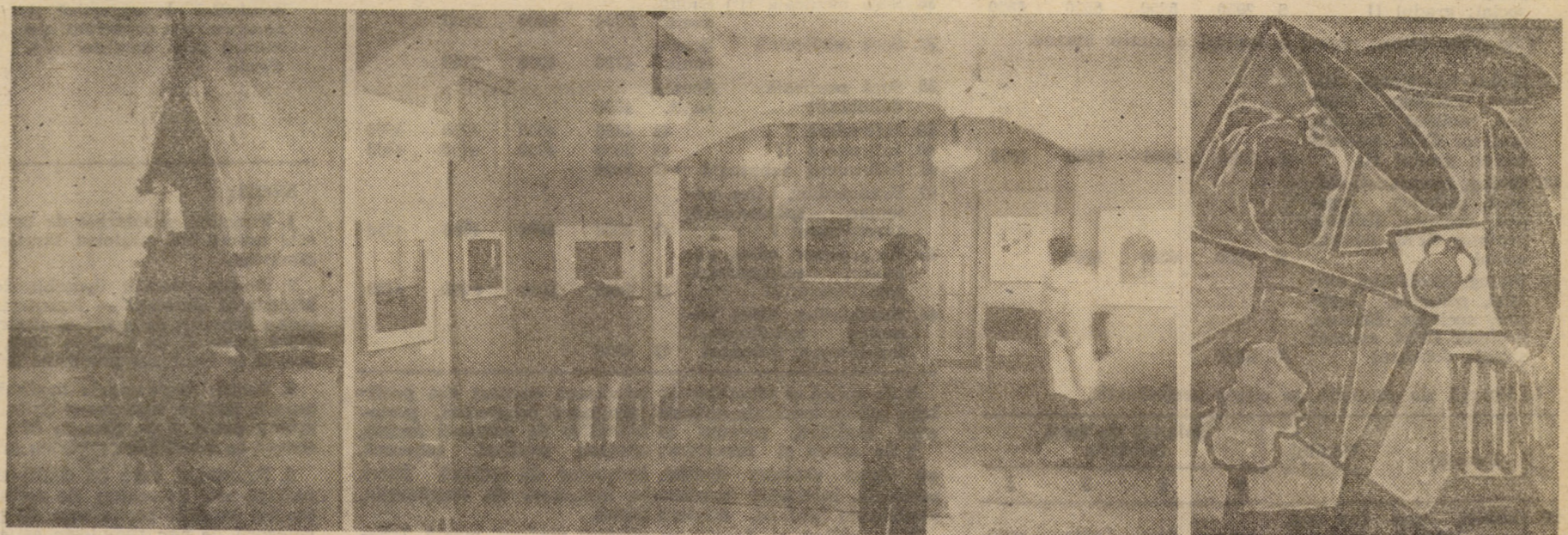
Constantaneu din expoziția de Litografii americane contemporane, organizată de Biblioteca americană din București în sălile Muzeului de istorie din Sibiu

DUMBRĂVENI: „Secret imperial”, orele 10; 17; 19,30.